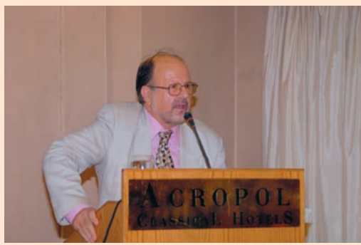
Ο επίτιμος Γεν. Γραμματέας κ. Παν. Μαχαίρας