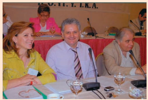
Το προεδρείο του Συνεδρίου